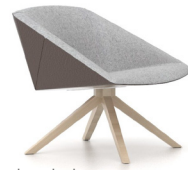
ped en bois

famille de produits _____ une seule session